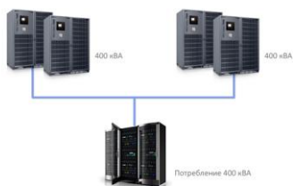
Рис. 2. Схема резервирования 2N

Для этого предусмотрены вариации: N+2, N+3 и т.д., в зависимости от требований уровня надежности и безопасности. Но стоит учитывать, что в этом варианте усложнение схемы может привести к большему простоям.