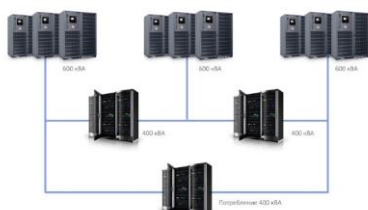
Рис. 3. Схема резервирования 3/2N

Схема 2(N+1) – это параллельная система резервирования с дополнительным элементом N, в которой резервный элемент дублируется, то есть это две полные системы по схеме N+1. При возникновении сбоя или необходимости технического обслуживания резервные элементы N остаются в любом случае, резервируются и ИБП, и системы охлаждения, ДГУ ждет своего часа на отдельной площадке. Эта система считается самой отказоустойчивой.