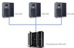
Рис. 1. Схема резервирования N + 1

N. Отличительная черта такой схемы резервирования в том, что как такового резервирования в ней нет, а надежность зависит от каждого отдельного элемента N. При сбое в работе одного из них незамедлительно будет прекращена вся работа системы. Причина в том, что, когда один из элементов выходит из строя, его нагрузку перераспределить будет некуда. В результате такого сбоя данные могут быть безвозвратно утеряны, и это повлечет за собой, соответственно, материальные убытки. Эта схема уже давно не эксплуатируется как раз по причине того, что цена простоя всего ЦОД в случае неполадок слишком высока. По сути, при данной схеме зачастую отсутствует сам ИБП или генератор, а если даже они и есть, то представлены одномодульными системами.